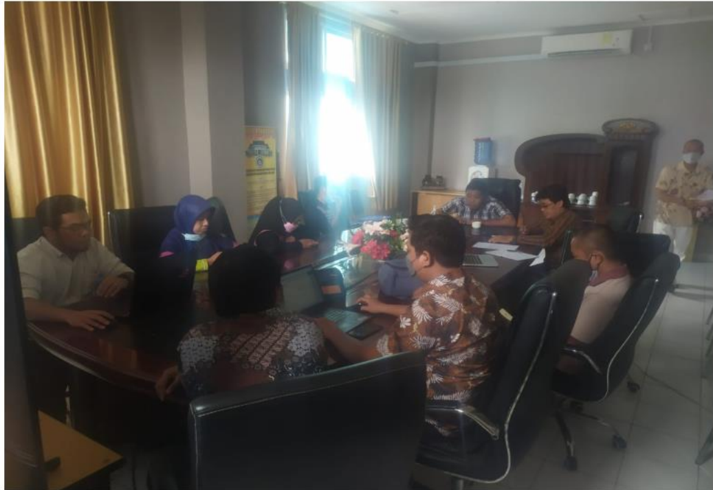
Lampiran 1. Foto